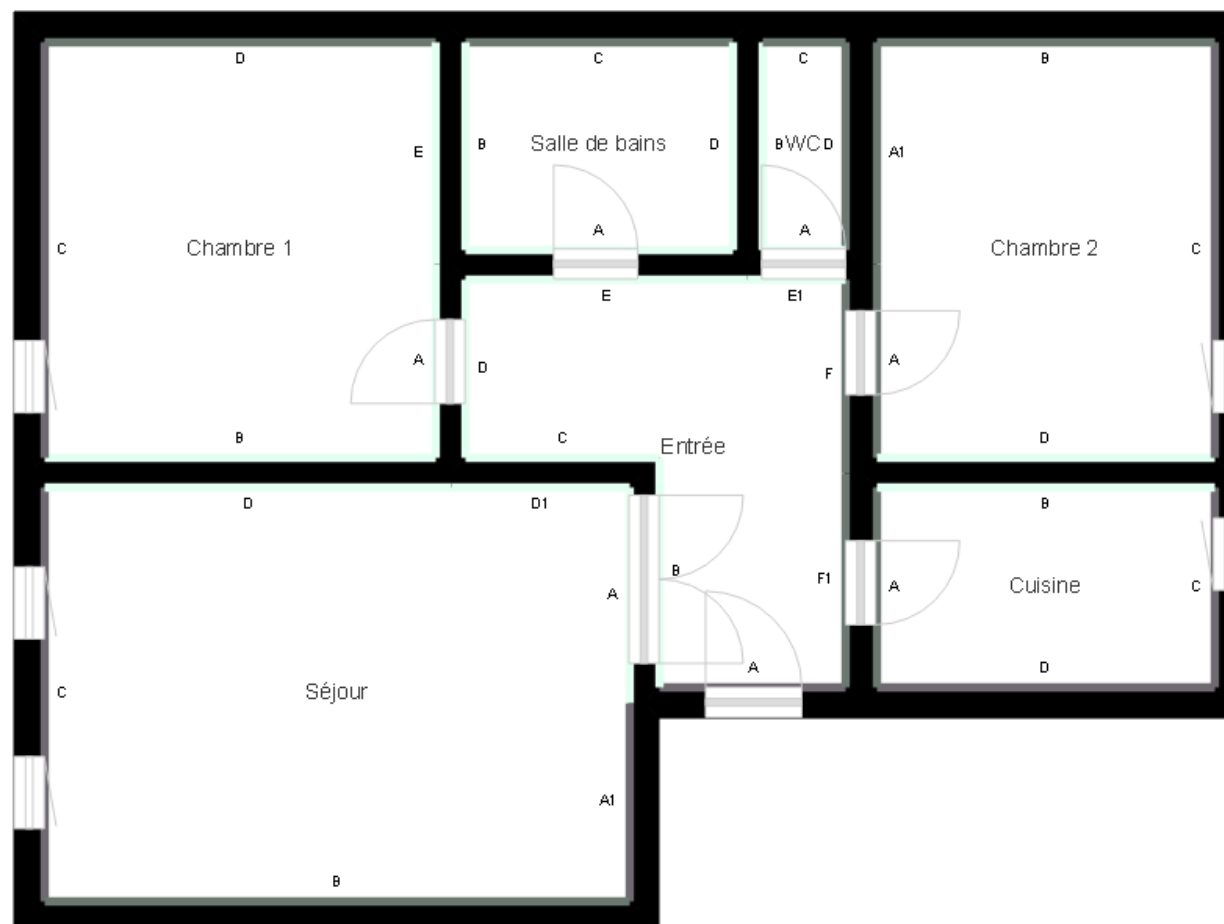
PLANCHE DE REPERAGE

Bien : 263LAJ0102 - LOGT 102 7 RUELLE AUX LOUPS 77600 BUSSY SAINT GEORGES